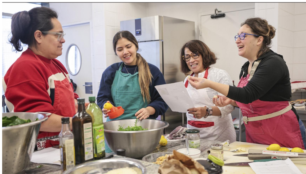
↑ Dans les centres sociaux, ce sont les habitantes et habitants qui font le programme, comme ici un atelier cuisine.