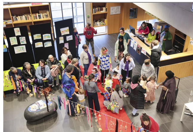
↑ Familles, retraités, personnes seules... Le maître mot des centres sociaux : la mixité.